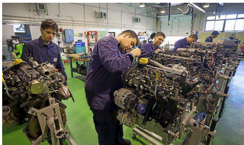
Estudiantes en el Centro Nacional de Formación Profesional Ocupacional de Valladolid.

En esta opción se aportan los conocimientos que se van a usar, mientras que en la universidad se imparten muchas asignaturas que nunca vas a emplear. Esta razón es-