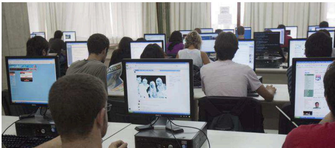
Estudiantes navegan por internet en un aula de informática.