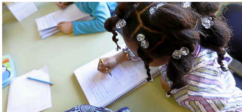
Una niña realiza sus deberes en un colegio de Valladolid.

Es fundamental que logre acercar posturas antagónicas para que todos caminen a una. De esta manera, podrán concretar las estrategias de priorización, intervención y dotación presupuestaria. El primero de los deberes que se pone sobre la mesa es el incremento de los recursos disponibles. La crisis económica dejó tocado uno de los pilares fundamentales del Estado de Bienestar y, ahora, es momento de devolverle, al menos, parte de lo