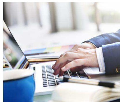
Una persona realiza un curso en su portátil.

La Universidad de Burgos ostenta el liderazgo regional en el desarrollo y coordinación de proyectos europeos de investigación, ejecutando actualmente 250 proyectos de investigación, de los cuales 33 son de carácter europeo, con una inversión en investigación de casi 18 millones de euros en 2019 y apoyándose en el trabajo de sus 75 grupos de investigación reconocidos y de sus 21 unidades de investigación consolidadas.