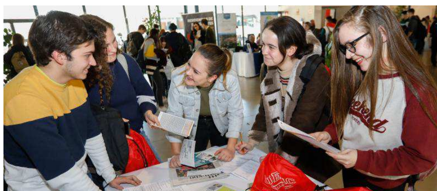
Varias asistentes a Unitour revisan la documentación en el hall de la Feria de Valladolid.

lón, darán a conocer todas sus novedades a los interesados.