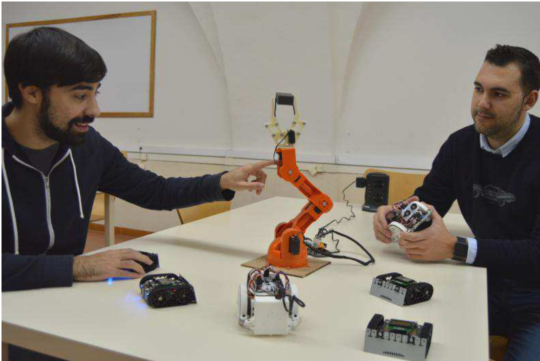
Dos investigadores trabajan en su proyecto de robótica en las instalaciones de la Universidad Pontificia de Salamanca. / REPORTAJE GRÁFICO: UPSA