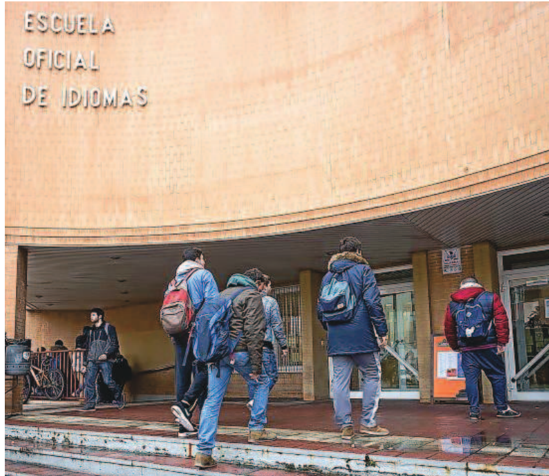
Alumnos acuden a sus clases en la Escuela Oficial de Idiomas de Valladolid.

A más responsabilidad, más sueldo y mayor número de lenguas. Ocho de cada 10 ofertas que van dirigidas a directivos exige un nivel alto en uno o varios idiomas; mientras que solo el 16% de las ofertas destinadas a empleados contiene este requisito. En los puestos técnicos, el porcentaje se sitúa en el 34%.