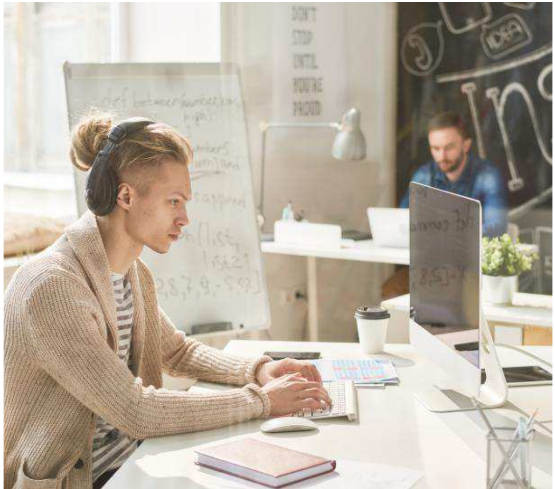
Dos jóvenes trabajan en un ambiente distendido que aumenta su rendimiento y mejora la productividad.

Conscientes de esta revolución laboral, los empresarios han decidido introducir la formación. Las grandes empresas cuentan con programas donde sus trabajadores pueden de-