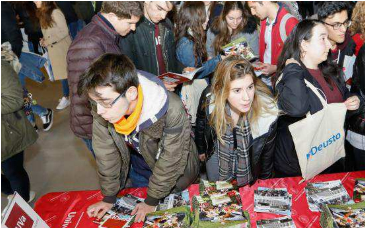
Un grupo de estudiantes de Bachillerato recogen información en el stand de la Universidad de Valladolid.