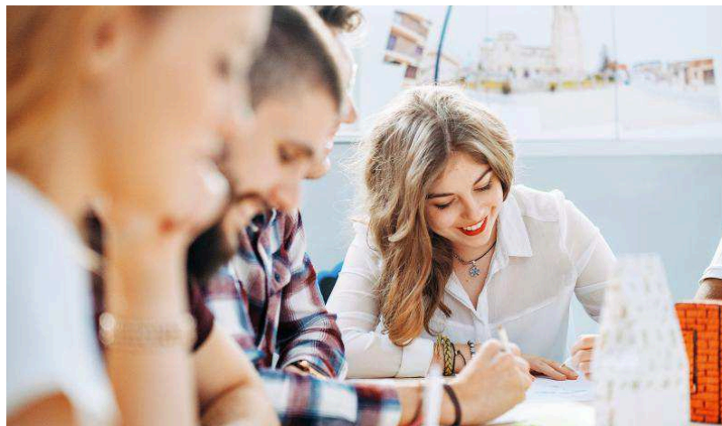
Alumnos en las instalaciones de la Escuela Superior de Diseño de Castilla y León.

Sus instalaciones situadas en el paseo Arco de Ladrillo de Valladolid, cuentan con lo último en tecnología en sus más de 1.200 metros entre los que se encuentran un estudio de fotografía, aula MAC, un FABLAB llamado La Creatura donde los alumnos no sólo se forman, sino que desarrollan su talento ayudados por los más de 50 profesores que forman su equipo docente.