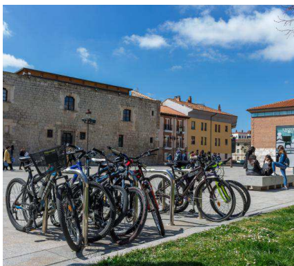
Estudiantes en el campus de la Universidad de Burgos.

Al pasear por el imponente patio medieval del Hospital del Rey, sede de la UBU, y contemplar cómo jóvenes de las más distintas nacionalidades se dan allí cita alguien podría pensar que ha aterrizado en medio de cualquier encuentro internacional. Muy al contrario, ese panorama conforma la realidad cotidiana de la Universidad de Burgos. No en vano, el 10% de su alumnado lo compone estudiantes internacionales. Si a ello se suma el dato de que para el próximo curso 2020-2021 la Universidad de Burgos ofrecerá 845 plazas de Erasmus en 37 países, no es difícil concluir que la UBU supone una excelente plataforma para todos aquellos estudiantes que buscan una experiencia universitaria internacional.