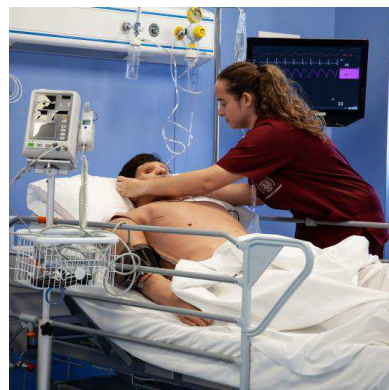
Centro de Simulación Clínica Avanzada de la UPSA.