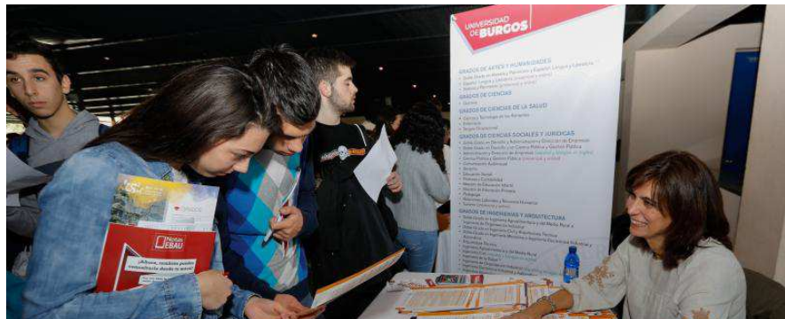
La Universidad de Burgos ofreció información personalizada a los que se acercaron.