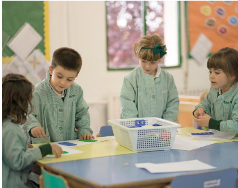
Un grupo de alumnos de Educación Infantil realiza una actividad en una de las aulas del centro.

En la Escuela Infantil del Colegio Internacional se utilizan metodologías activas, recursos y herramientas del currículum británico. Lo hacen en un ambiente de inmersión en inglés y con profesorado nativo altamente cualificado. Los niños, desde 1 año de edad, se divierten aprendiendo, gracias a un plan di-