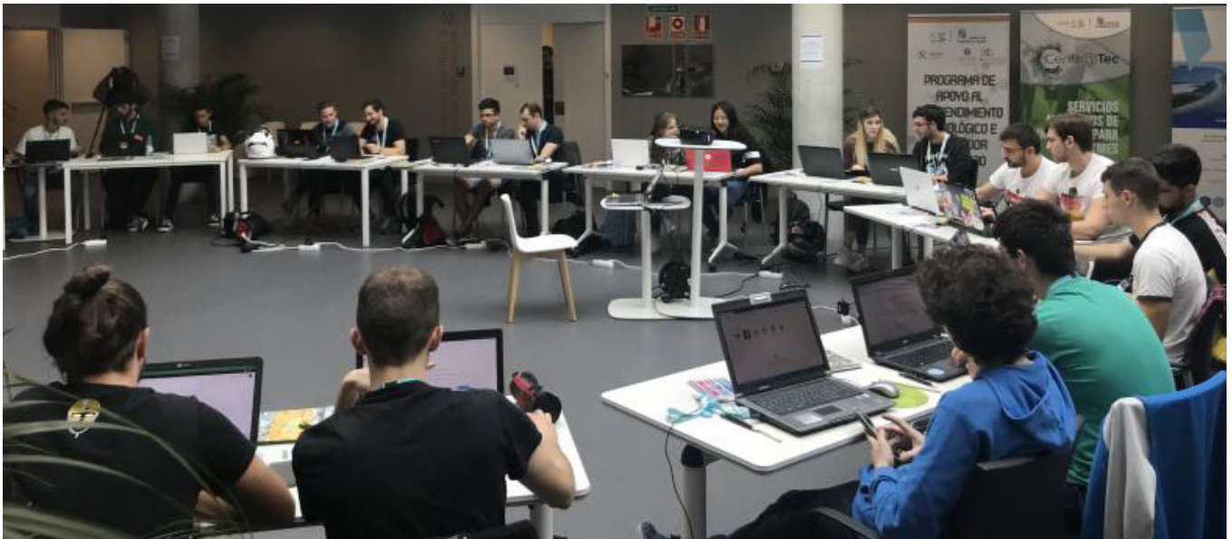
Estudiantes de la Universidad de Salamanca durante una de las actividades de los programas de emprendimiento.