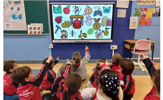
Alumnos en el Colegio San Agustín. / COLEGIO SAN AGUSTÍN

Otro de los principios pedagógicos que guían a este colegio es el respeto a los ritmos de cada niño. «Se entiende que cada niño es único y tiene un proceso de desarrollo particular, por lo que se adapta el ritmo y la metodología de enseñanza a las necesidades de cada