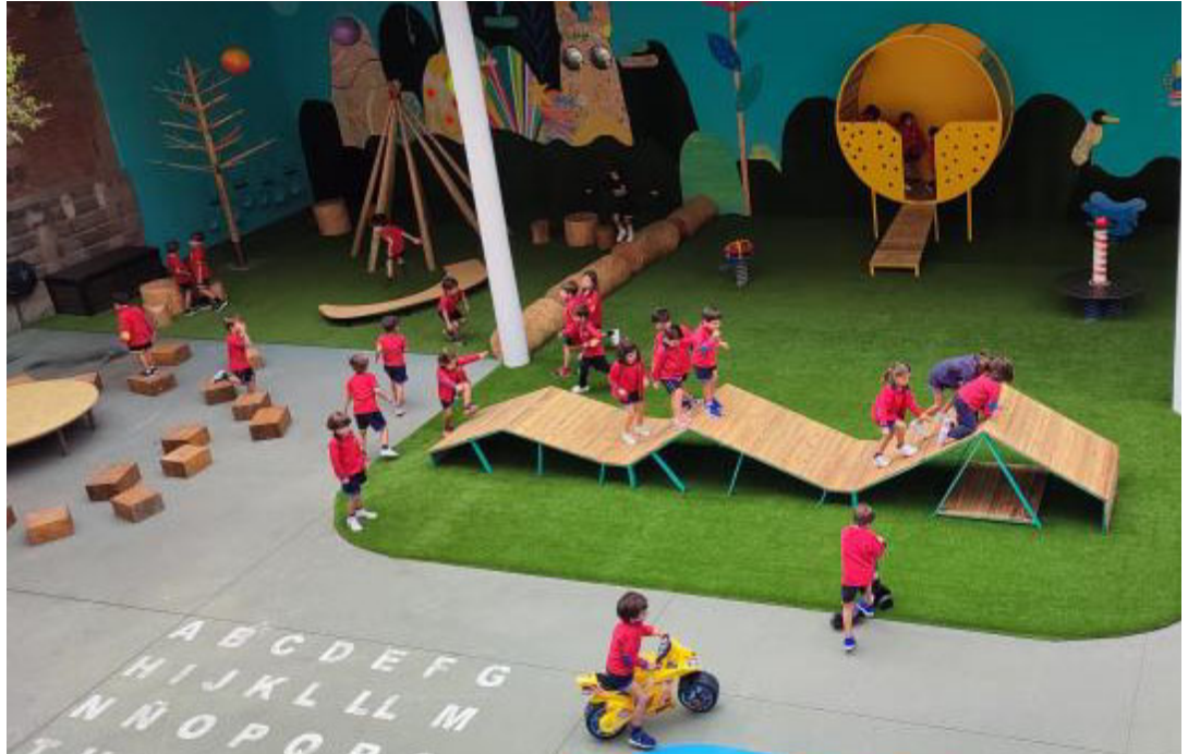
Niños se divierten en las diferentes actividades del patio infantil. / COLEGIO LOURDES

Un patio de colegio convertido en espacio que permite el desarrollo de