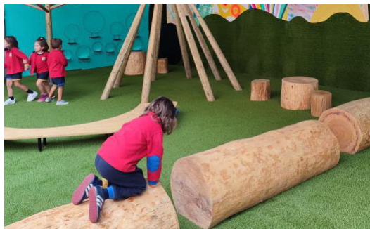
Una de las zonas del patio infantil.