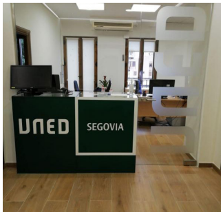
Instalaciones de la UNED SEGOVIA.

admitidos en preinscripción del curso 2022/2023 sin matricular que cuenten con la autorización de la Comisión Coordinadora del máster. Estudiantes matriculados en un mínimo de 20 créditos del primer periodo de matrícula 2022/2023; o estudiantes matriculados, independientemente de los créditos, que como máximo les falten dos asignaturas para concluir el plan de estudios más el TFM y hayan sido autorizados por la Comisión Coordinadora del máster.