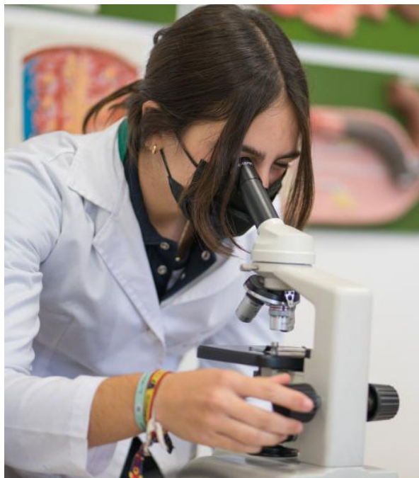
Una alumna mira por el microscópico.

señado para potenciar su creatividad natural. Desarrollan así, un entusiasmo innato por descubrir todo lo que hay a su alrededor, en un entorno seguro garantizado donde crecen felices. Hay tres áreas de desarrollo que son especialmente importantes en esta etapa: la co-