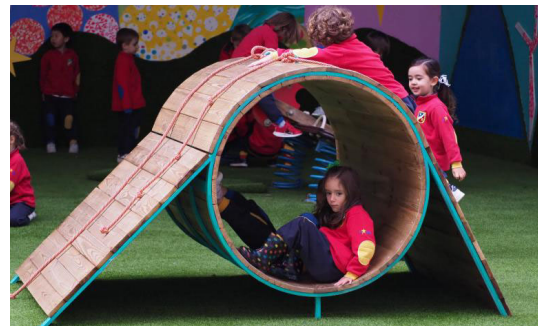
Alumnos del colegio disfrutan de estas instalaciones.

diferentes entornos, psicomotriz, saludable, creativo, social. La pretensión última del nuevo patio del Colegio de Lourdes es que los niños y niñas se sientan felices en su colegio y que las familias puedan disfrutar de un espacio en donde estar con sus hijos disfrutando y conviviendo.