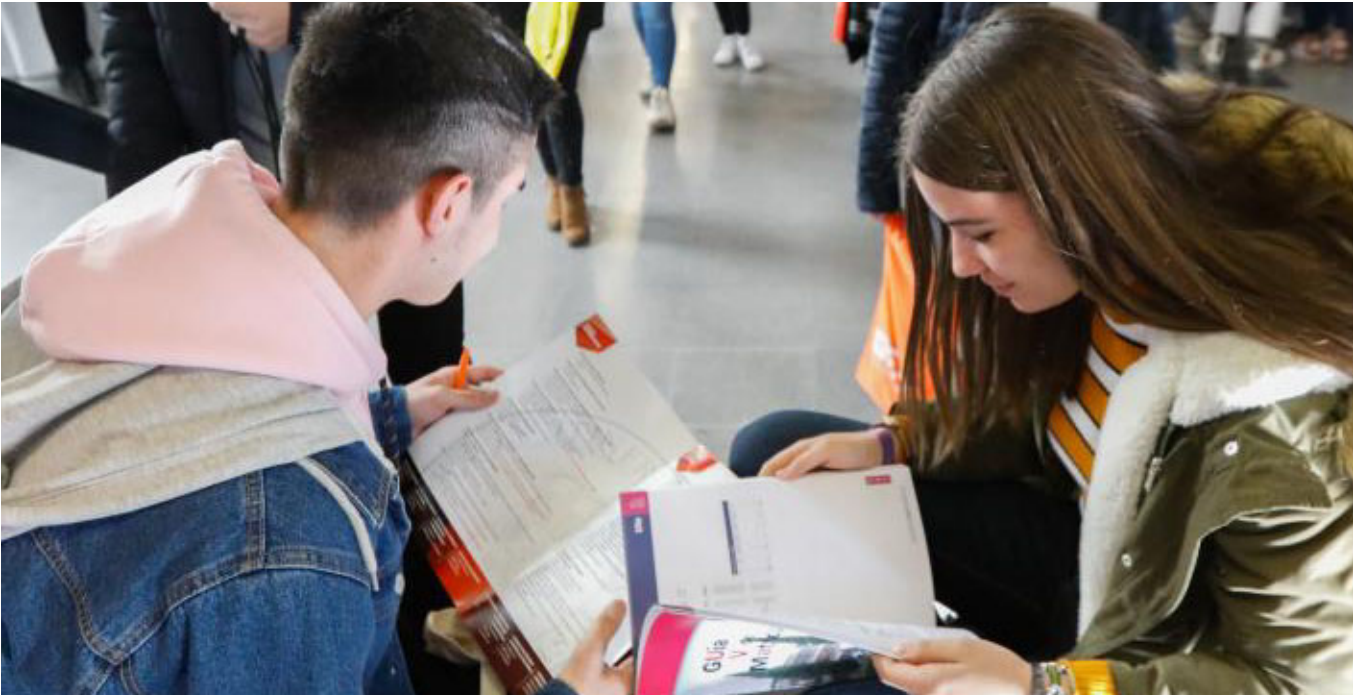
Dos jóvenes revisan distintas propuestas formativas de cara a formarse para acceder al mundo laboral.