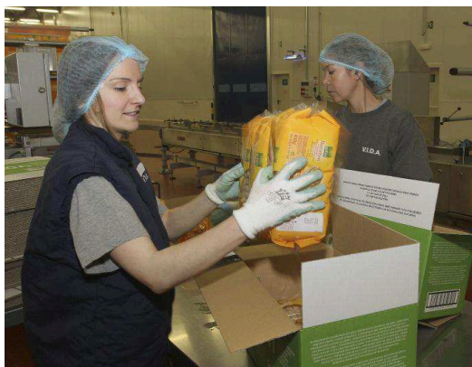
El empleo femenino tiene especial importancia en este sector.

Las ayudas, que se podrán solicitar hasta el próximo 2 de abril, dispondrán 35 millones de euros, lo que suponen un 80% más que lo ofrecido el pasado año cuando fueron de 19 millones. Una cantidad que todavía no se ha sido abo-