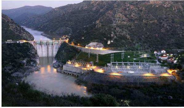
Central hidroeléctrica de Saucelle en la provincia salmantina.

La energía afronta una transformación sin precedentes. La tecnología está cambiando la cade-