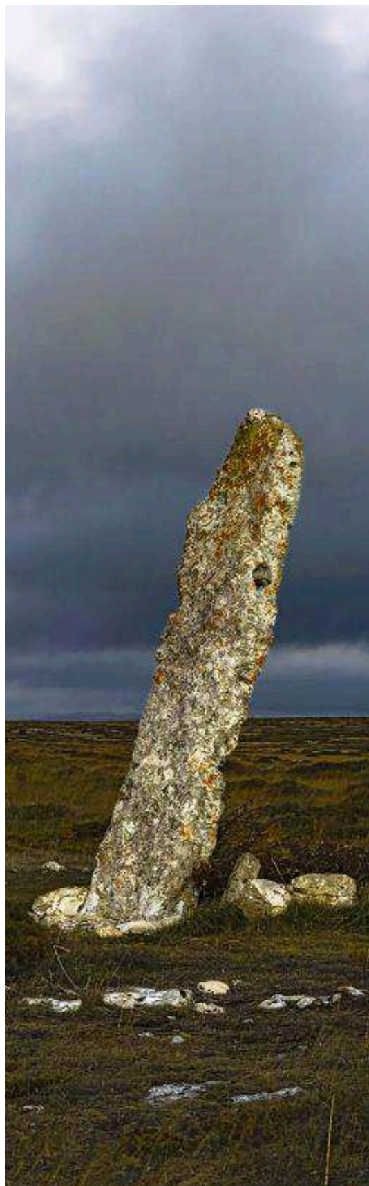
Menhir de Canto Hito, un sencillo monumento megalítico de tipo funerario que se levanta a tan solo 1.500 metros de la Cueva de los Franceses.

En el año 2020 el Comité Ejecutivo del Geoparque Mundial de Las Loras espera revalidar este título de Geoparque Mundial de la Unesco. Uno de los objetivos que se marcan las administraciones responsables de la gestión de este espacio es continuar con el plan de señalización de carreteras y recursos y el mantenimiento de rutas y equipamientos. En conservación, colaborando con la Junta de Castilla y León, se sigue avanzando en cuestiones de protec-