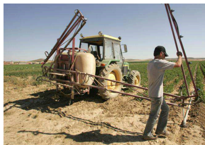
Uno de los retos es incorporar 3.500 jóvenes a la actividad agraria e incrementar un 30% el número de mujeres. Debajo, un agricultor realiza labores de siembra de patatas en Pomar de Valdivia (Palencia).

un nuevo documento dirigido a este colectivo al que se quiere dar más protagonismo, no solo desde el punto de vista de la titularidad, sino también en la asunción de responsabilidades en las explotaciones, así como en su implicación en el movimiento cooperativo, ya que solo 7.600 mujeres de Castilla y León son socias de estas entidades de las 285.000 de toda España.