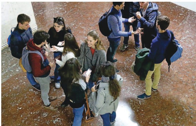
Estudiantes en la Facultad de Medicina de la Universidad de Valladolid.

Estos indicadores se reconocen en Alumni, Award, HiCi, N&S, PUB y PCP. La universidad más antigua de Castilla y León, la USAL, obtuvo una puntuación de cero en Alumni y Award y sumó 7,3 en HiCi, 4,9 en N&S, 25,8 en PUB y 13,5 en PCP. La UVA no tuvo ningún punto en Alumni ni Award ni HiCi, pero consiguió un 3,7 en N&S, 24 en PUB y 11,7 en PCP.