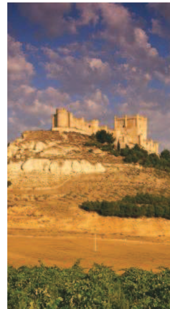
Castillo de Peñafiel (Valladolid), sede del Museo del Vino y emblema del sector del enoturismo en la región.

Para su puesta en marcha, Fine ha contado con el apoyo de importantes bodegas de Ribera de Duero y Rueda, como Abadía de Retuerta, Matarromera, Pago de Carravejas, Protos e Yllera; así como el respaldo de la Junta, el Ayuntamiento de Valladolid y la Diputación Provincial. La estructura de Fine 2020 está enfocada a la generación de encuentros de negocios en diferentes escenarios, como son un área de exposición comercial y de promoción, espacios de reuniones, transferencia de conocimiento y zonas para entrevistas agendadas y espontáneas.