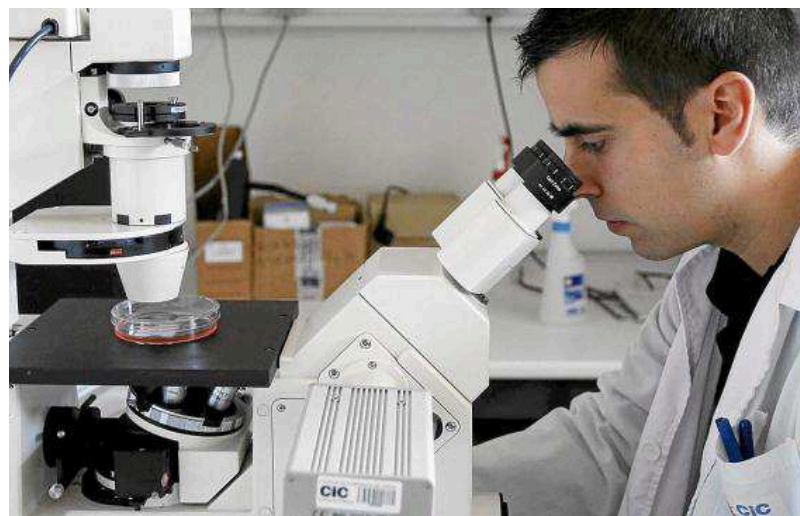
Un investigador mira a través del microscopio en un laboratorio de Salamanca.

Otro pilar destacado es el Centro de Investigación del Cáncer de Salamanca. Nació en 1997 para integrar investigación competitiva y de excelencia sobre cáncer en tres niveles distintos: básico, clínico y aplicado o traslacional, informan en su página web. Por tanto, cubre un amplio espectro que va desde la investigación básica de laboratorio hasta el ámbito clínico. Además, cuenta con varios mecanismos de financiación para asegurar la necesaria productividad científica, su competitividad internacional y su adecuación a las tendencias más actuales de la oncología.