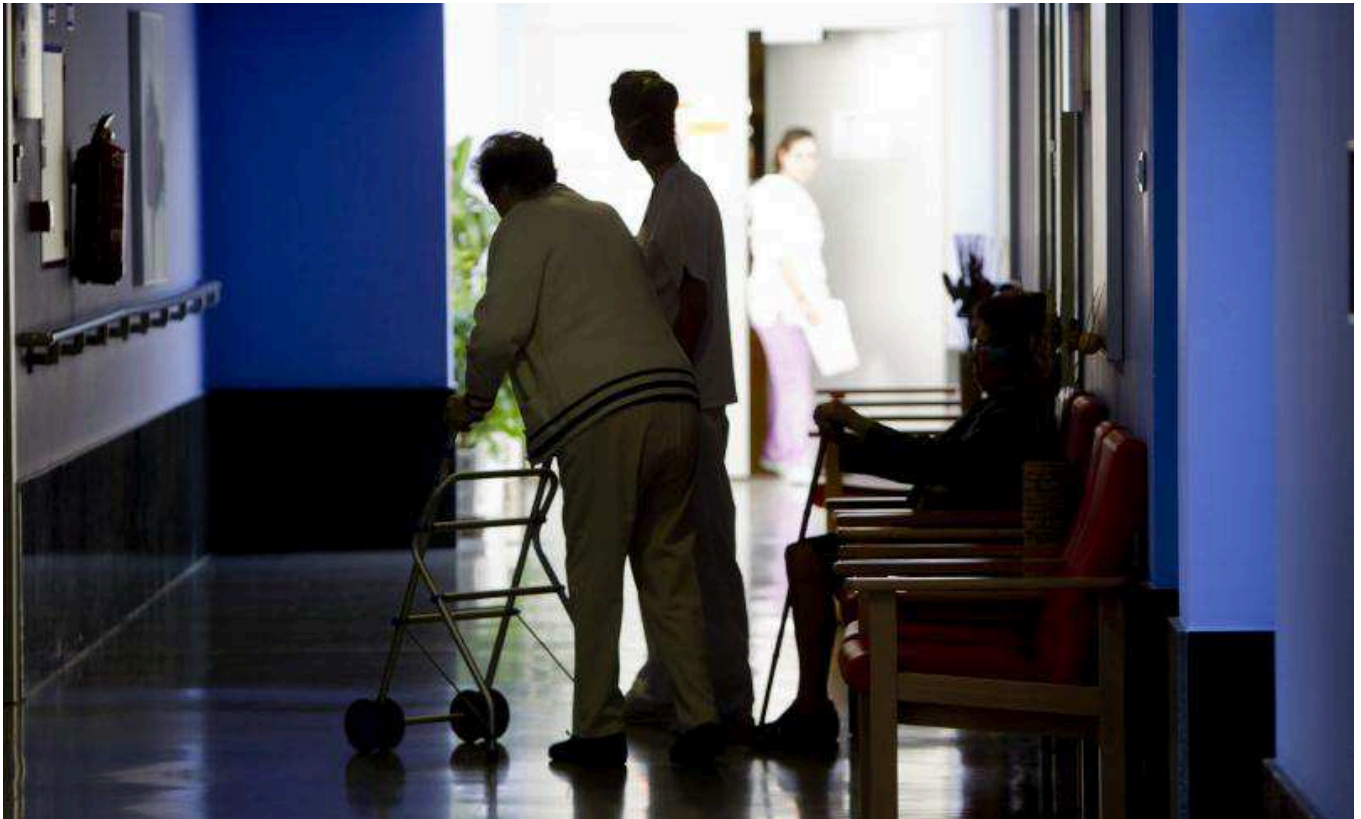
Una persona cuida a varias personas mayores en una residencia.