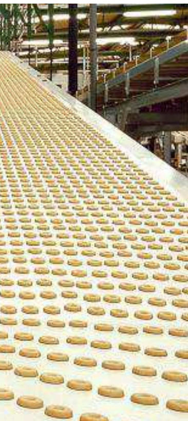
Planta de fabricación de la galletera Gullón en Aguilar de Campoo (Palencia). Es una de las principales empresas del sector.

Entre esas iniciativas destaca nuevas líneas de subvenciones específicas para la agroindustria, con 100 millones de euros más para inversiones y otras actuaciones, como distribución, transformación, comercialización, promoción, formación o cooperativismo, tal y como anunció el presidente de la Junta de Castilla y León, Alfonso Fernández Mañueco durante la inauguración de la ampliación de la fábrica de Cascajares en Dueñas (Palencia).