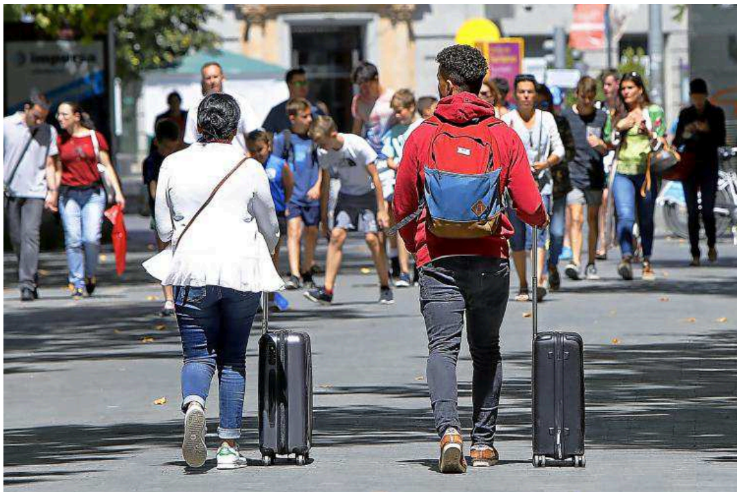
Turistas paseando por una de las calles de Valladolid.