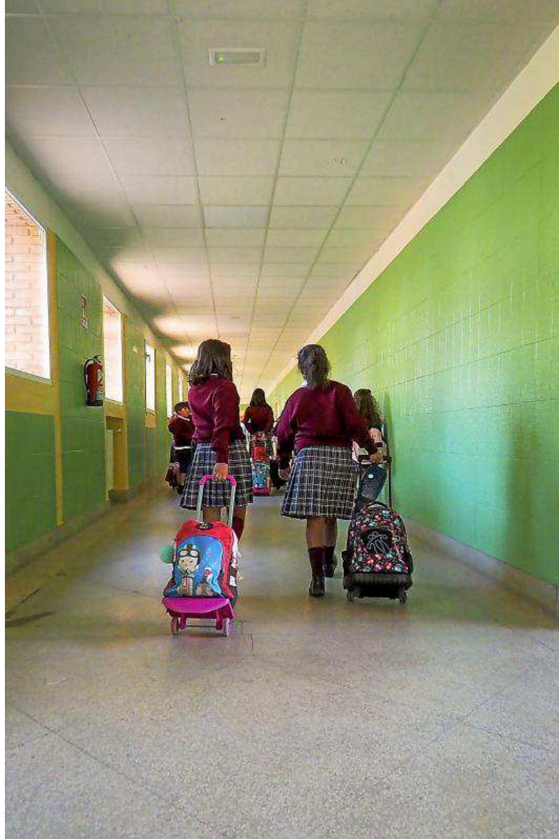
Das niñas arrastran sus carros con libros en el Colegio Nuestra Señora del Rosario de Valladolid.

En Ciencias las noticias no son tan halagüeñas. Se situaron por detrás de Galicia y perdieron 18 puntos. Una de las razones que explican este descenso es el modelo bilingüe. Se quedaron en la decimocuarta posición en el cómputo de países que participan en el informe Pisa. Es verdad que es una