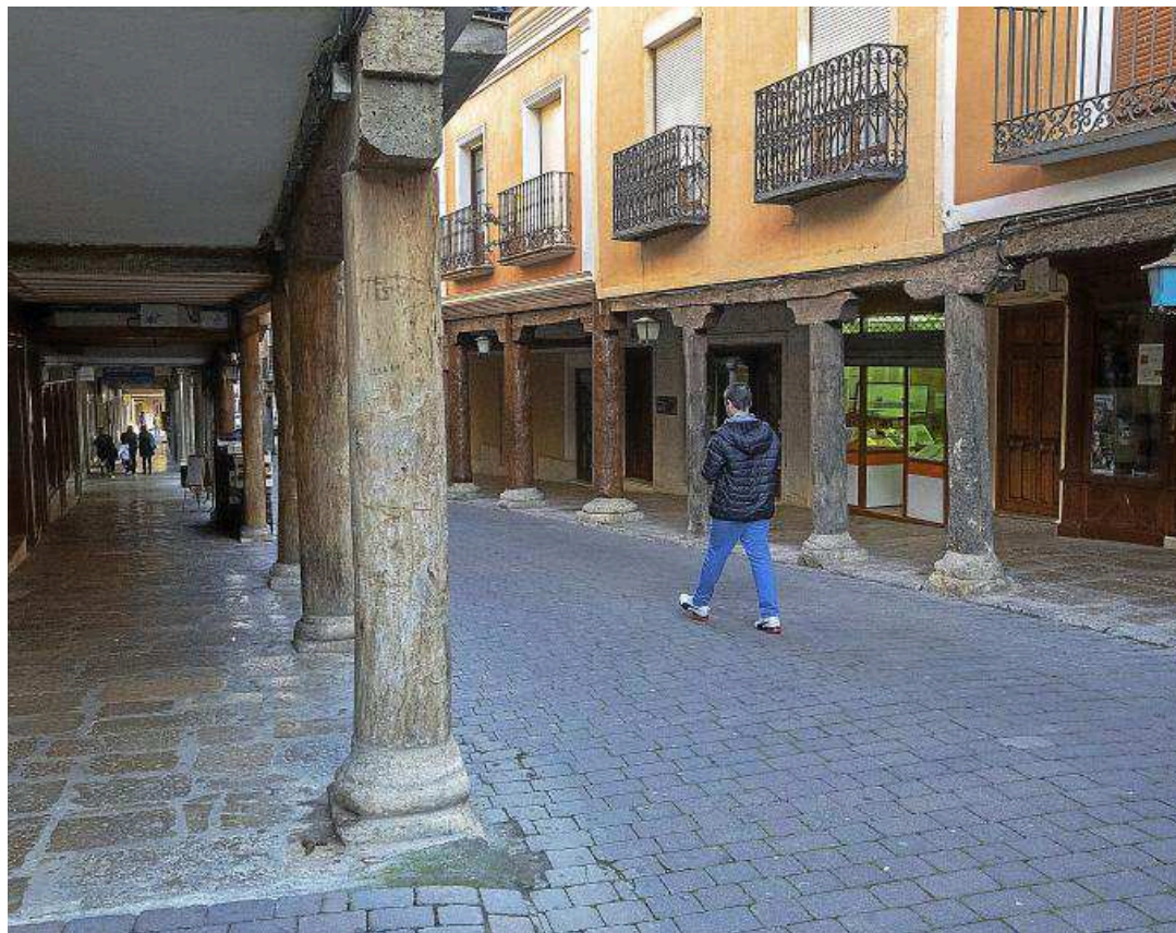
Una persona pasea por la calle la Rúa de Medina de Rioseco.

En este repaso el presidente del Ejecutivo regional mencionó contar con un transporte que llegue a todos los rincones —implantación de un Bono de Transporte