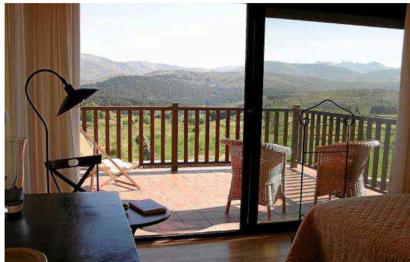
Terraza de una casa con vistas a Gredos, en el municipio de Hoyos del Espino (Ávila).

Además, el pasado año los 23 albergues de Castilla y León contabilizaron 46.652 viajeros y 133.230 noches, mientras que los apartamentos turísticos, que ofertan 5.916 plazas, registraron 186.392 viajeros y 450.505 pernoctaciones.