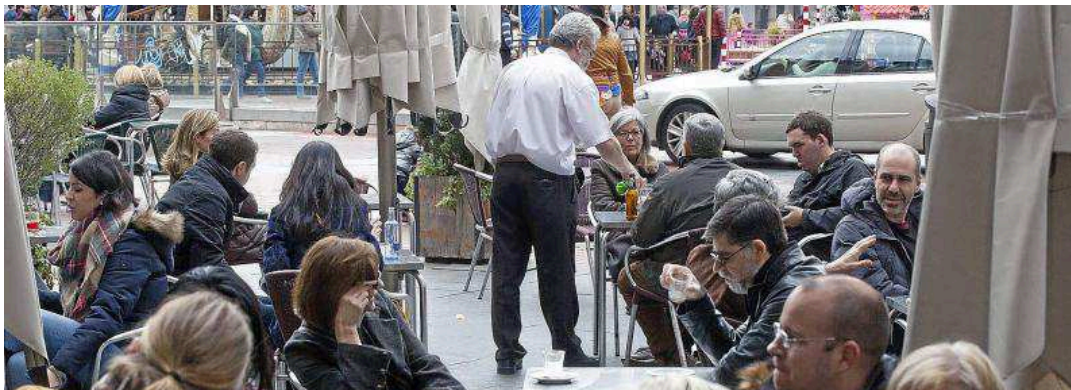
Un camarero sirve consumiciones a un grupo de personas en una terraza de una bar del centro de Valladolid.

En definitiva, CGB Avisas resultará de lo más eficiente para los gestores de las entidades y para los ciudadanos, lo que hará que estos últimos sean agentes activos de su comunidad, lo que ayudará a mejorar la infraestructura del municipio.