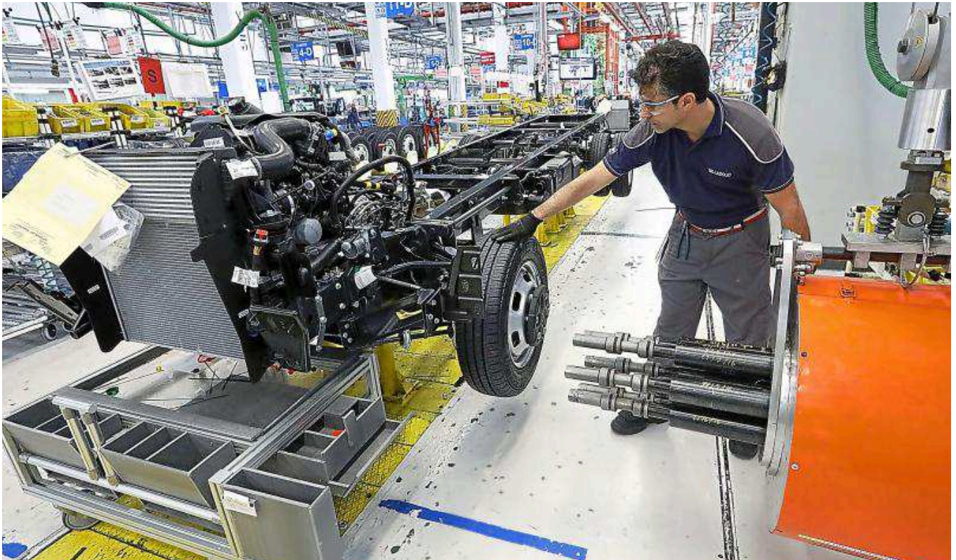
Un operario revisa la estructura de un camión en las instalaciones de la factoría de Iveco en Valladolid.