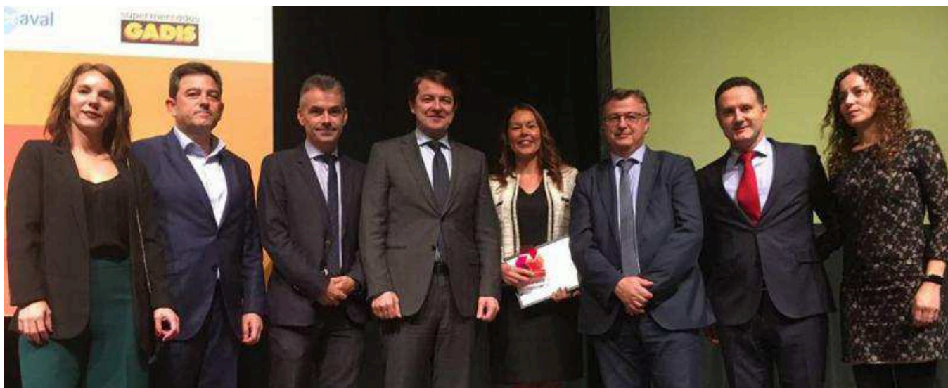
Aquona recibió el pasado mes de noviembre el Premio a la 'Mejor Acción Social' por la revista Castilla y León Económica.