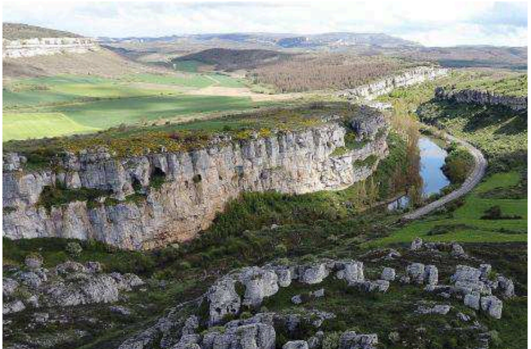
Cañón de la Horadada. A lo largo de 3 kilómetros entre Mave y Villaescusa de las Torres se abre este espacio desde donde se pueden contemplar las Tuerces

Por otro lado, el comité responsable ha indicado que en el territorio del Geoparque se celebrarán las Jornadas Abiertas de los Geoparques Españoles, con la asistencia de responsables del complejo al Congreso Europeo que se celebrará en Sevilla.