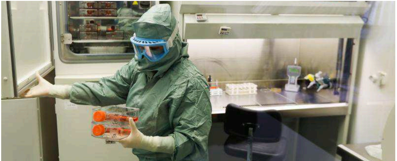
Una persona revisa una serie de muestras en las instalaciones del Instituto de Biología y Genética Molecular de Valladolid.